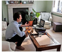
El 60% de los colaboradores teme volver a trabajar de forma presencial debido a su exposición al contagio, según un sondeo de Page Personnel.