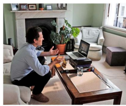
El 60% de los colaboradores teme volver a trabajar de forma presencial debido a su exposición al contagio, según un sondeo de Page Personnel.