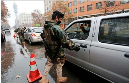
RICHLAND — La lluvia no fue un impedimento para que nuevamente se vieran importantes flujos vehiculares en la capital. El Gobierno anunció un refuerzo de los controles para revertir este escenario.

En esa línea, el titular de Defensa detalló que a la fecha se han realizado 17 millones 471 mil fiscalizaciones a personas en toque de queda, aduanas y cordones sanitarios y cuarentenas, y 6 millones 518 mil controles a vehículos.